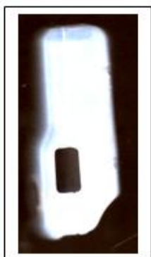
Custodia antipioggia in silicone